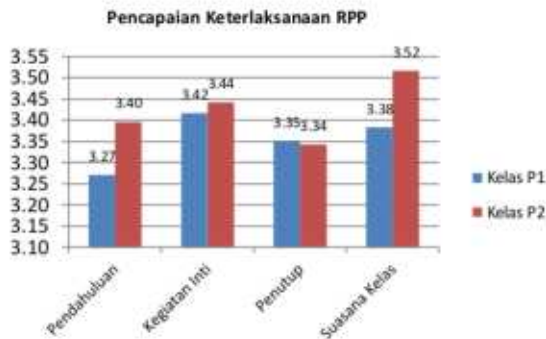
Gambar 1 Histogram rata-rata kemampuan dosen mengelolapembelajaran model inkuiri modifikasi

Keterlaksanaan RPP menggambarkan kemampuan atau kompetensi dosen dalam pengelolaan pembelajaran disebut sebagai kompetensi pedagogik yang merupakan kemampuan dalam mengelola pembelajaran yang meliputi kegiatan pendahuluan, kegiatan inti, kegiatan penutup serta evaluasi pembelajaran. Rata-rata nilai kemampuan dosen mengelola pembelajaran berada pada rentang 3,27 - 3,52 dengan kategori cukup baik sampai baik. Rata-rata skor kemampuan guru mengelolah model pembelajaran inkuiri modifikasi dideskripsikan pada Gambar 1.